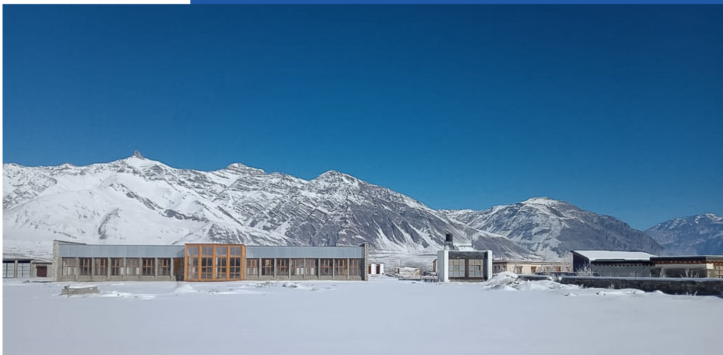
Internat (RBP) et campus de la LMHS sous la neige en février 2021