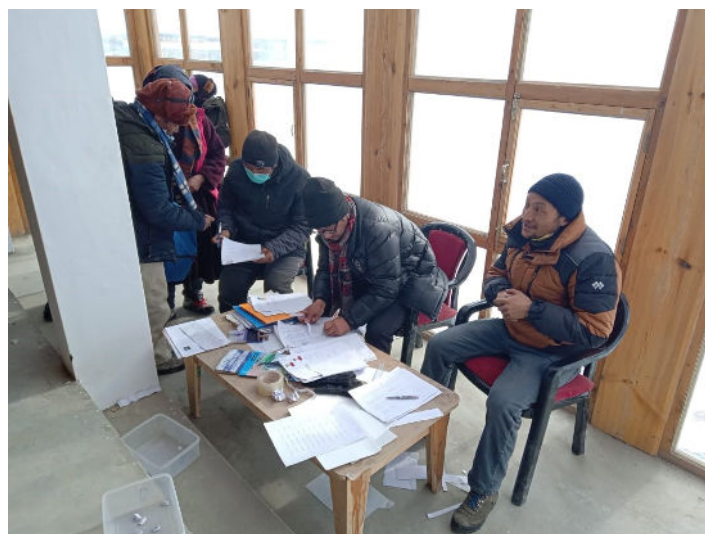
Préparation de la rentrée scolaire 2021 avec les parents d'élèves